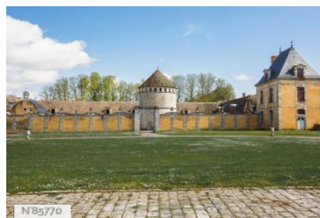
Château du Mesnil-Voysin - Colombier