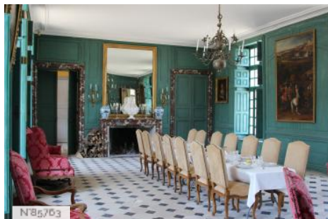
Château du Mesnil-Voysin - Salons