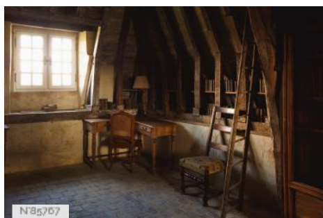
Château du Mesnil-Voysin - Combles