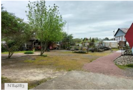
Le Bazarnaom - Le Jardinaom