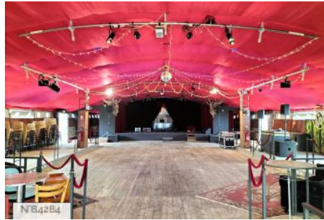
Le Bazarnaom - Le bal monté