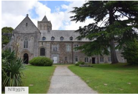
Abbaye de la Lucerne - Abbey church