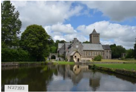
Abbaye de la Lucerne