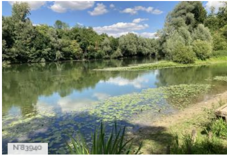
Parc de Noisiel - Bords de Marne