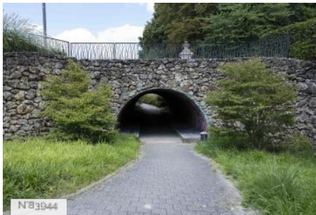
Parc de Noisiel - Tunnel