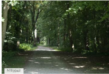
Parc de Noisiel - Forêt