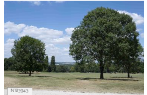
Parc de Noisiel - Prairies