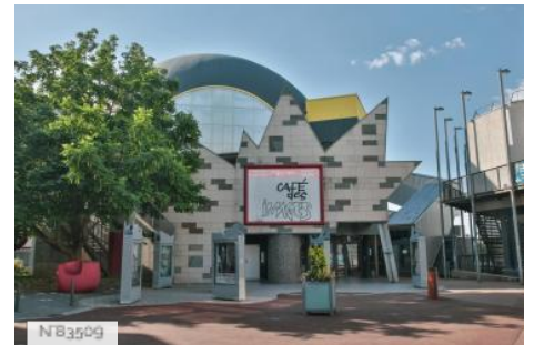
Cinéma Café des images