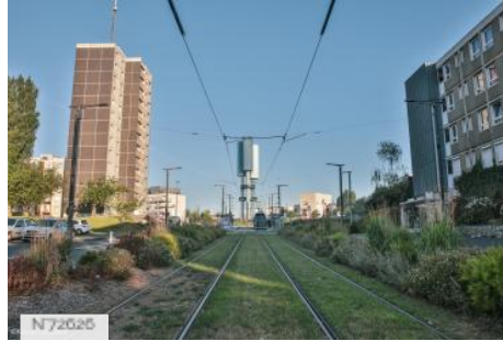
City - Hérouville-Saint-Clair