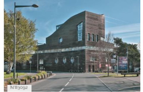
Collège Lycée expérimental