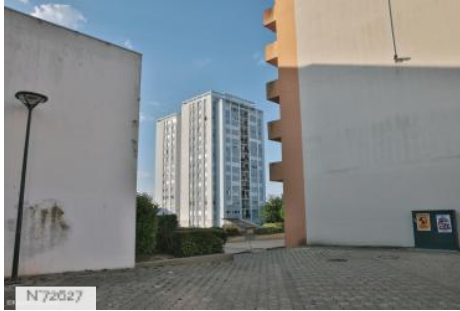
City Hérouville-Saint-Clair - Quartier Les Belles Doors