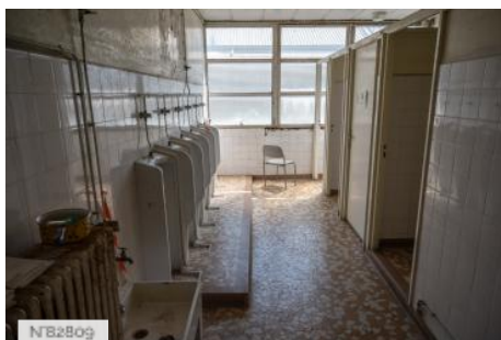
Aérodrome de Melun-Villaroche - Sanitaires désaffectés