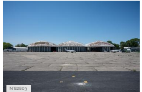
Aérodrome de Melun-Villaroche - Hangars Eiffel - Extérieurs