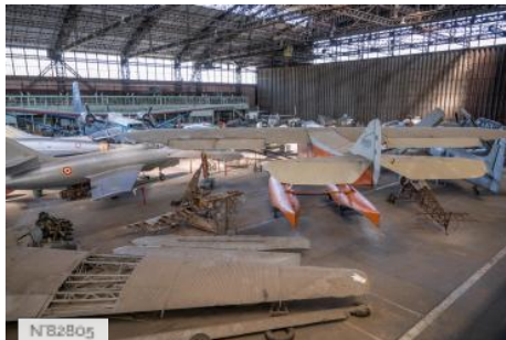
Aérodrome de Melun-Villaroche - Hangars Eiffel - Grand hangar