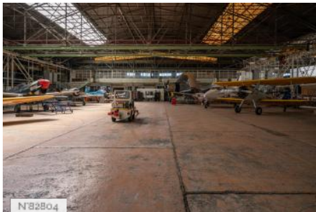
Aérodrome de Melun-Villaroche - Hangars Eiffel - Hangar des avions de collection