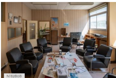
Aérodrome de Melun-Villaroche - Salles et bureaux