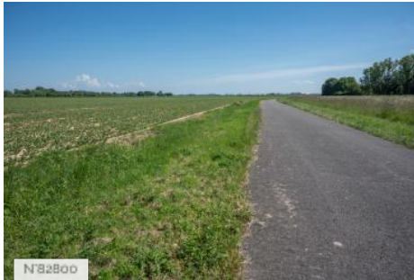
Aérodrome de Melun-Villaroche - Hangars Eiffel - Intérieur Avion