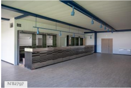
Aérodrome de Melun-Villaroche - Bar et salle de réception