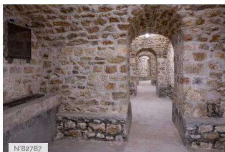
Fort de Saint-Cyr - Cellules