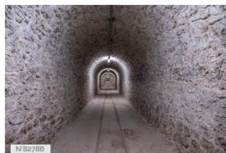
Fort de Saint-Cyr - Tunnel