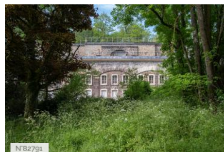
Fort de Saint-Cyr - Extérieurs