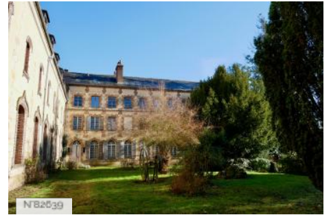
Abbaye Saint-Nicolas - Bâtiments conventuels