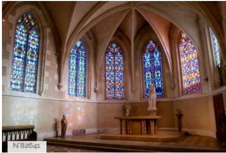
Abbaye Saint-Nicolas - Eglise abbatiale