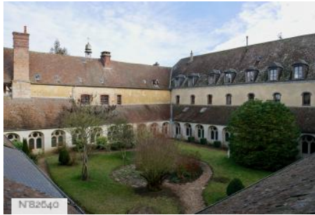
Abbaye Saint-Nicolas - Cloître