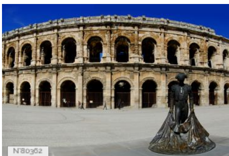
N°80362 Amphitheatre of Nîmes