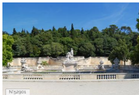
N°52901 The Gardens of the Fountain