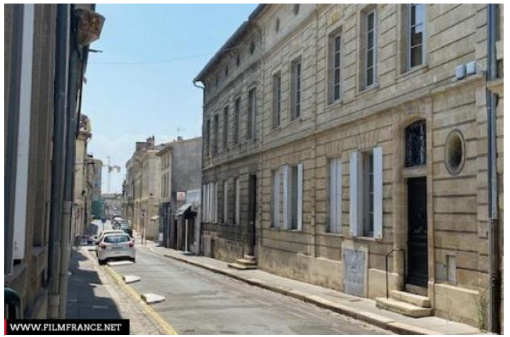
Caption: Appartement loft au coeur de la bastide