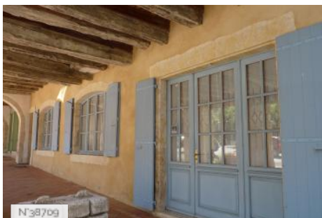
Village de Montréal du Gers