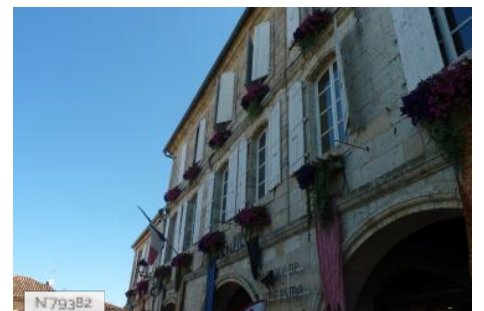
Mairie de Montréal du Gers