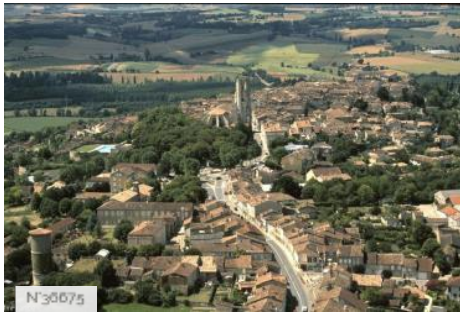
Ville de Lectoure