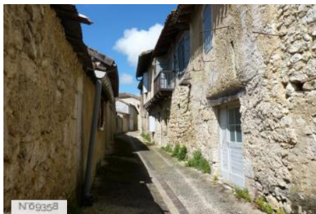
Le Vieux Saint-Clair