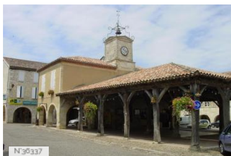
Halle de St Clair