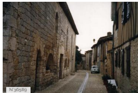
Rues de St Clair