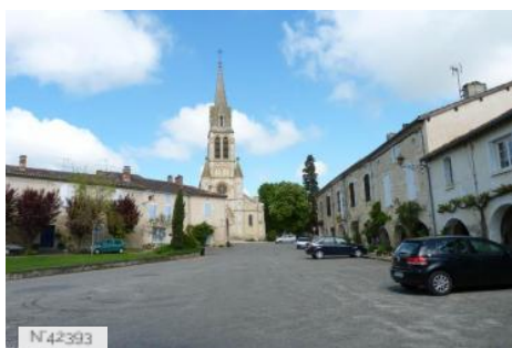
Place de la République de St Clair