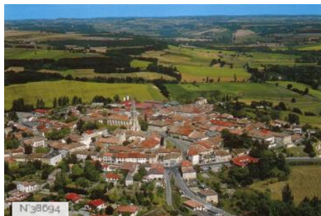
Village de St Clair