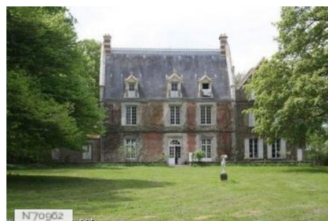
Manoir de Gravigny