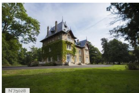
Le manoir d'Elise