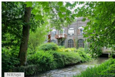
Usine à Zabu