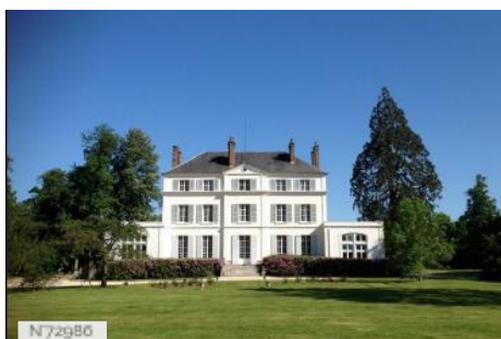
Château du bois de la Lune