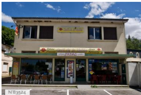
Café Tabac Presse