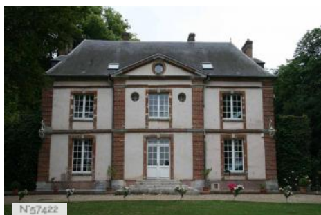
Château des Lions