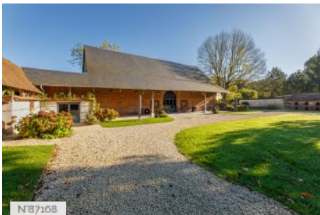
Domaine de Guerquesalle