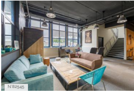
Espace de coworking La Filature