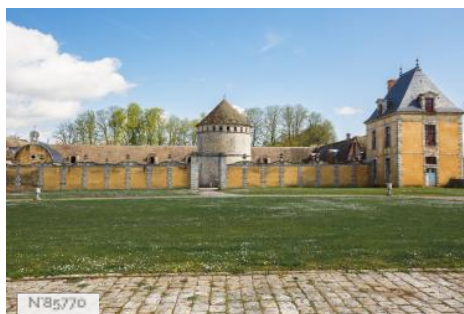
Château du Mesnil-Voysin - Colombier