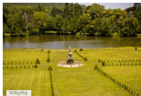
Château du Mesnil-Voysin - Parc