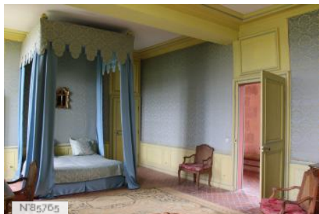
Château du Mesnil-Voysin - Chambres