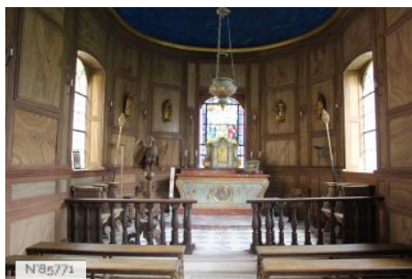
Château du Mesnil-Voysin - Chapelle