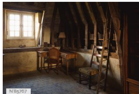
Château du Mesnil-Voysin - Combles