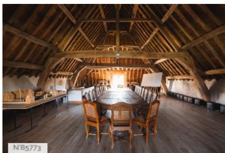
Château du Mesnil-Voysin - Salle dans les combles