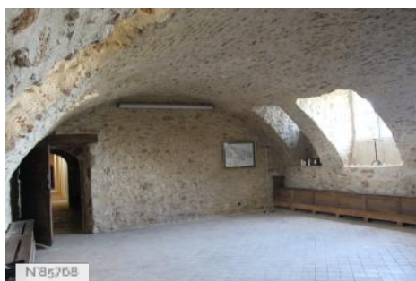
Château du Mesnil-Voysin - Caves