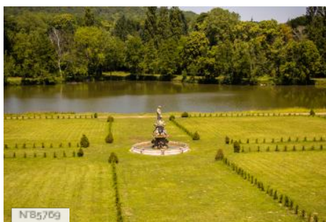
Château du Mesnil-Voysin - Parc