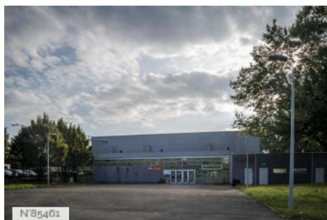
Ville de Saint-Denis - Parc des sports Auguste Delaune - Gymnase