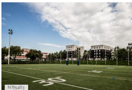
Ville de Saint-Denis - Parc des sports Auguste Delaune - Terrains de rugby