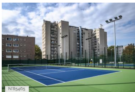
Ville de Saint-Denis - Parc des sports Auguste Delaune - Terrains de tennis extérieurs