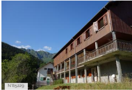
Centre des Mélèzes