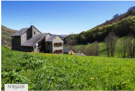
Centre des Agudes