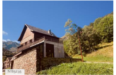
Gîte de l'Orry