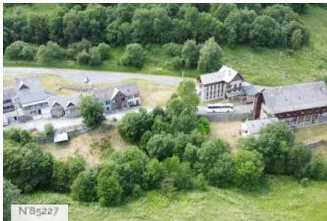
Domaine de La Vallée blanche