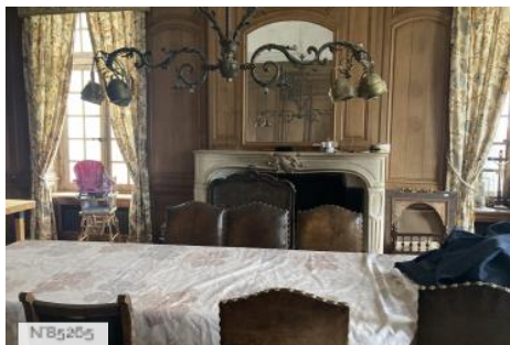
Chateau d'Hazeville - Salle à manger