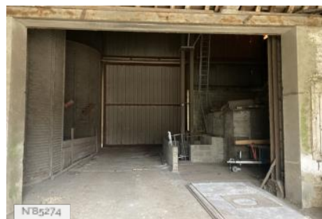
Chateau d'Hazeville - Silo