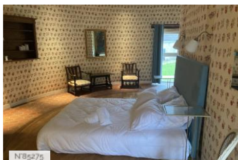
Chateau d'Hazeville - Pigeonnier - Suites