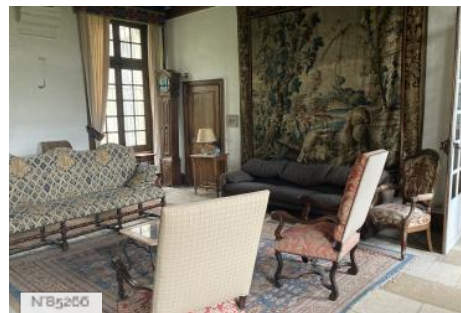
Chateau d'Hazeville - Salon