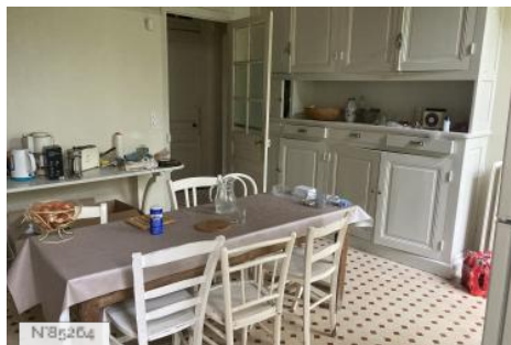
Chateau d'Hazeville - Cuisine