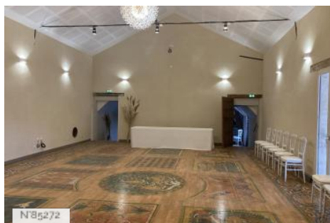
Chateau d'Hazeville - Salles de réception (Fontaine et Persée)