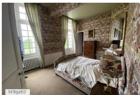
Chateau d'Hazeville - Chambres