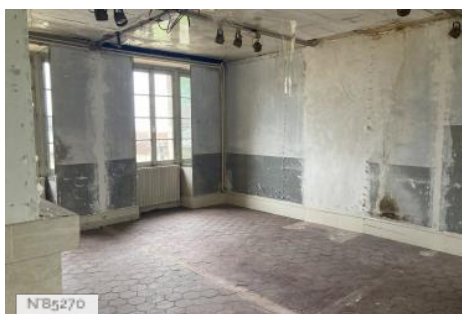
Chateau d'Hazeville - Appartement désaffecté