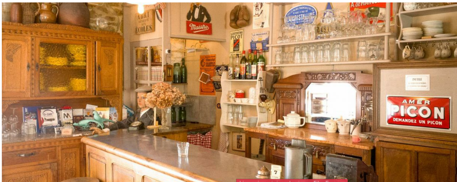
Lieu pré-reperé par le réseau Film France