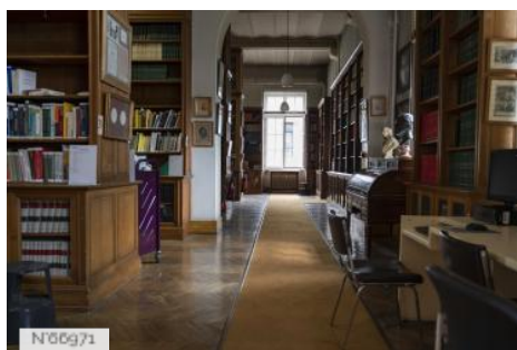
Ecole Nationale Vétérinaire d'Alfort - Bibliothèque