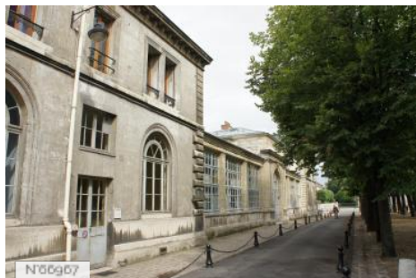
Ecole Nationale Vétérinaire d'Alfort - Extérieurs