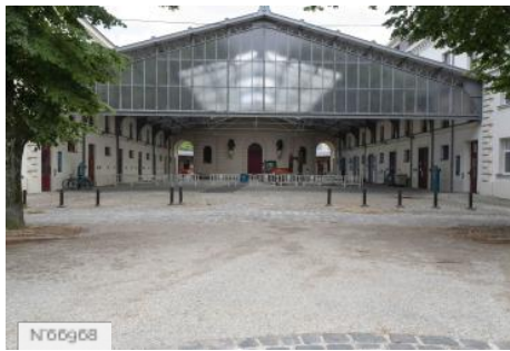
Ecole Nationale Vétérinaire d'Alfort - Halle pavée