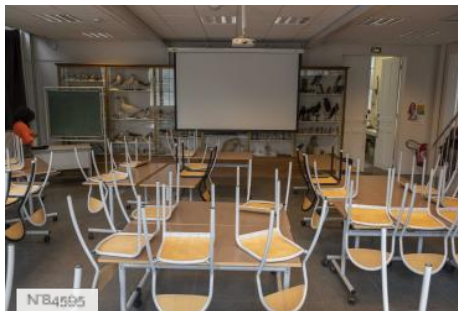
Ecole Nationale Vétérinaire d'Alfort - Salles de classe