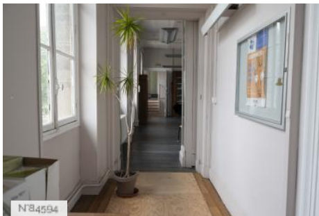
Ecole Nationale Vétérinaire d'Alfort - Etage de bureaux