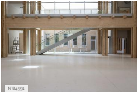
Ecole Nationale Vétérinaire d'Alfort - Bâtiment Agora - Hall