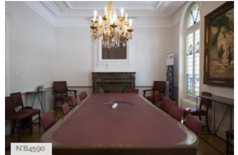
Ecole Nationale Vétérinaire d'Alfort - Salle des actes