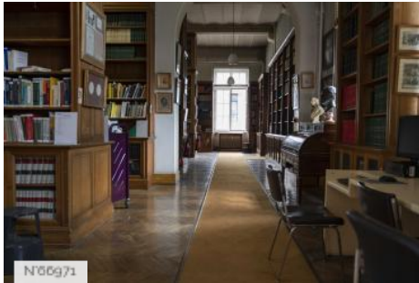
Ecole Nationale Vétérinaire d'Alfort - Bibliothèque