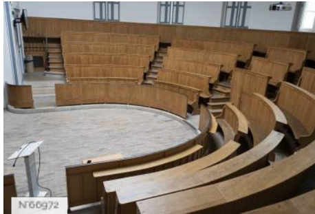
Ecole Nationale Vétérinaire d'Alfort - Amphithéâtre d'anatomie