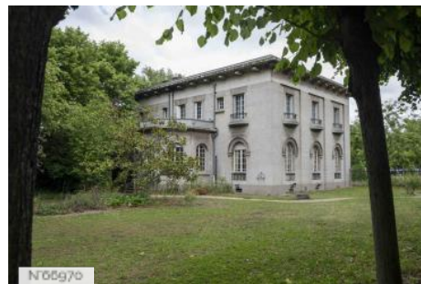
Ecole Nationale Vétérinaire d'Alfort - Pavillon