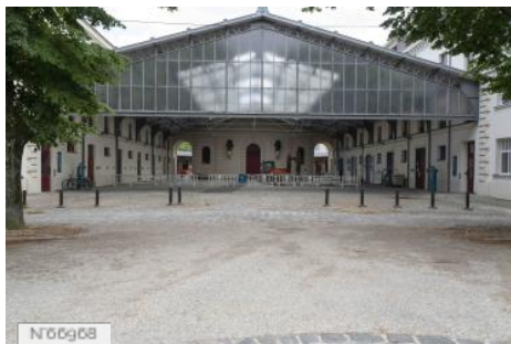
Ecole Nationale Vétérinaire d'Alfort - Halle pavée