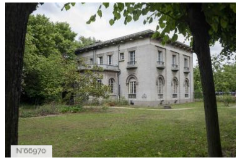
Ecole Nationale Vétérinaire d'Alfort - Pavillon