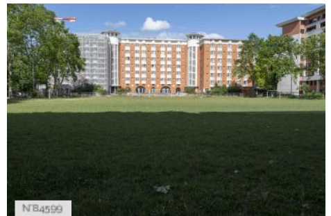
Ecole Nationale Vétérinaire d'Alfort - Terrain de football