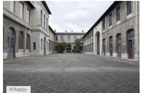
Ecole Nationale Vétérinaire d'Alfort - Cour pavée