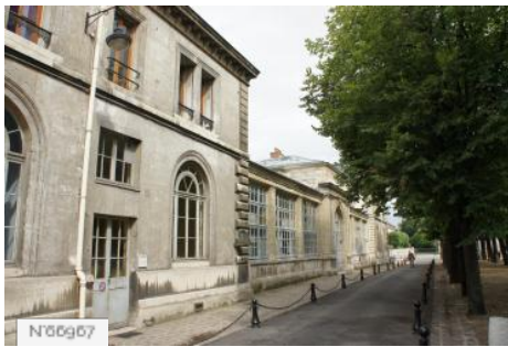
Ecole Nationale Vétérinaire d'Alfort - Extérieurs