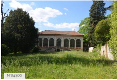
Château de Thézan- Orangerie