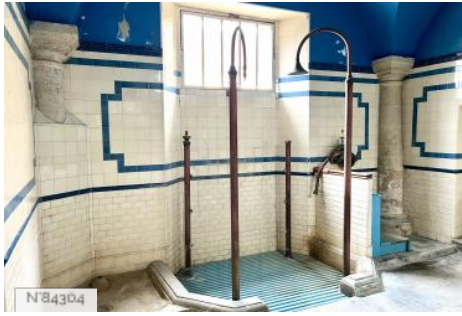
Château de Thézan -Bains