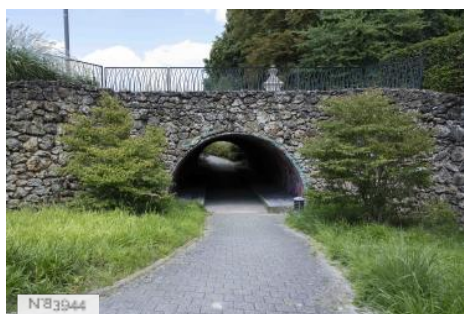
Parc de Noisiel - Tunnel