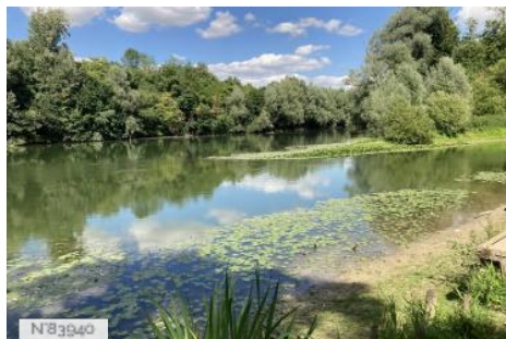
Parc de Noisiel - Bords de Marne