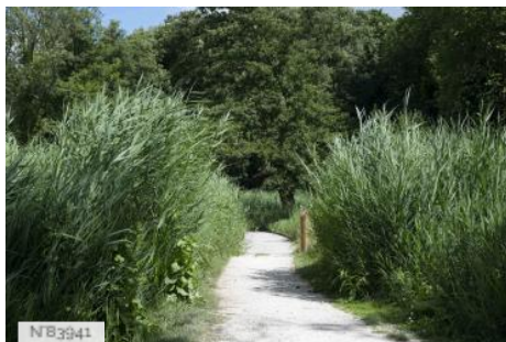
Parc de Noisiel - Cours d'eau