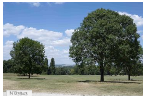
Parc de Noisiel - Prairies