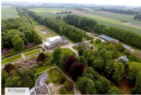
Château du Grand Daubeuf - bâtiments