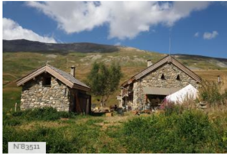
Refuge du Pic du Mas de la Grave (Hautes-Alpes)