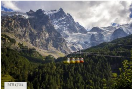
Téléphérique des Glaciers de la Meije - La Grave