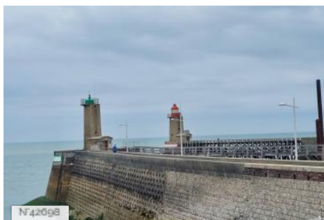
Jetée de Fécamp