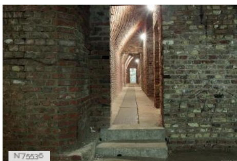
Les cavités du Val Criquet - Ancien hôpital Allemand