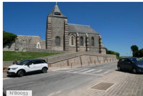
Eglise Notre Dame de Salut de Fécamp