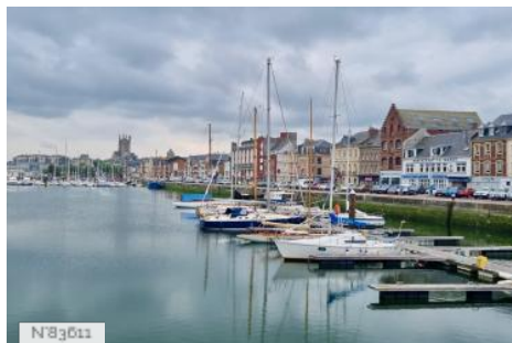
Ville de Fécamp