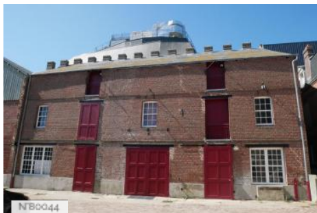
Saurisserie La boucane du Grand Quai Fécamp