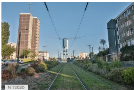
Hérouville Saint-Clair - Centre-ville