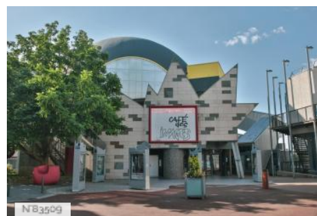
Cinéma Café des images