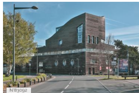
Collège Lycée expérimental