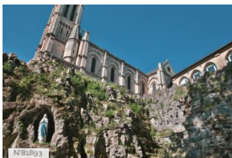
Le Petit Lourdes