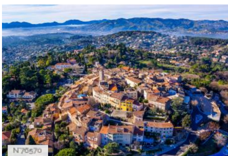
Ville de Mougins