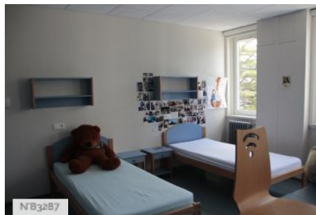
Cité scolaire René Billères - Argelès Gazost - Internat