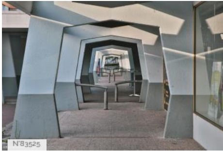
Hérouville Saint-Clair - Quartier Le Grand parc/La Haute Folie