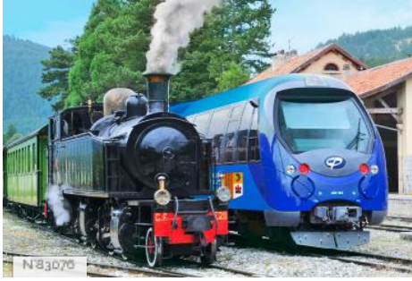
Trains et matériel roulant des Chemins de fer de Provence