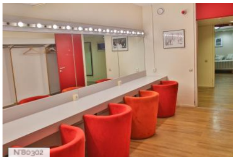
Comédie de Caen - Coulisses