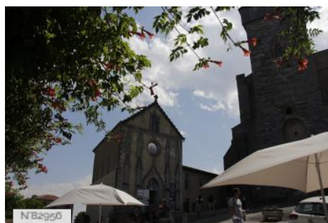
Chapelle des Olivétains