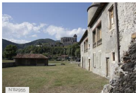
Ancienne ferme Bordères