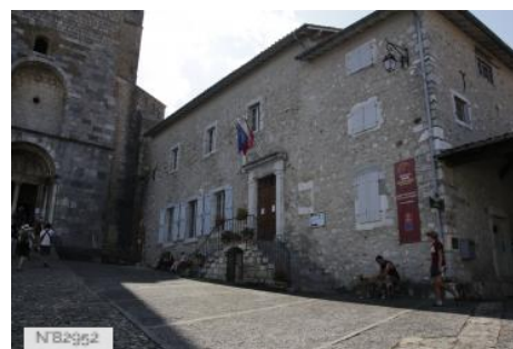
Mairie de Saint-Bertrand-de-Comminges