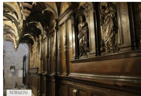
Cathédrale Sainte-Marie - intérieur