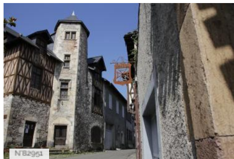
Rues de Saint-Bertrand-de-Comminges