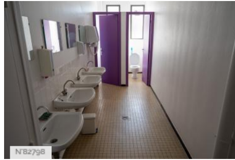
Aérodrome de Melun-Villaroche - Bâtiment contemporain - Extérieurs