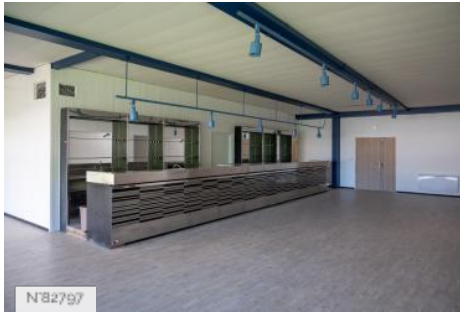
Aérodrome de Melun-Villaroche - Bâtiment contemporain - Salons