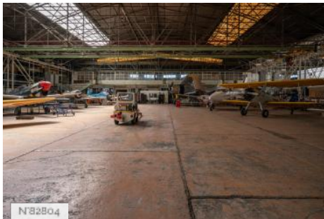
Aérodrome de Melun-Villaroche - Hangars Eiffel - Hangar des avions de collection