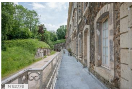
Fort de Saint-Cyr - Balcon