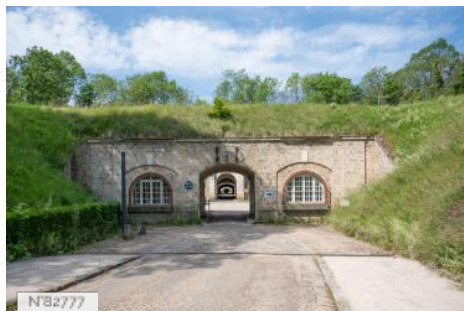
Fort de Saint-Cyr - Entrée principale