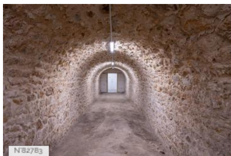
Fort de Saint-Cyr - Salles voutées