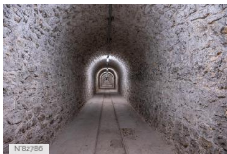
Fort de Saint-Cyr - Tunnel