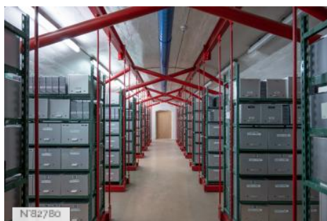
Fort de Saint-Cyr - Magasins d'archives