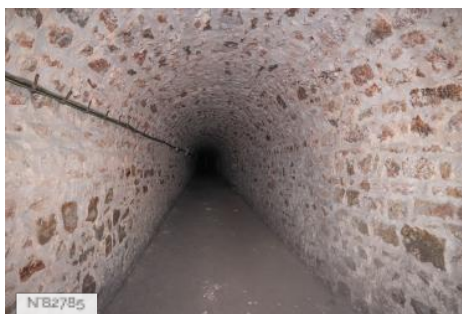
Fort de Saint-Cyr - Couloirs en pierres