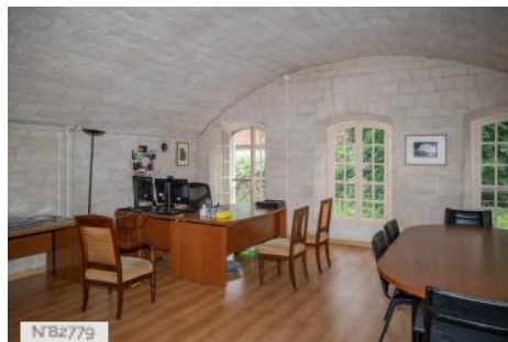
Fort de Saint-Cyr - Bureaux