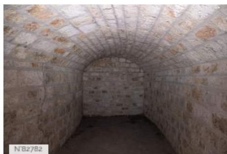
Fort de Saint-Cyr - Cachots