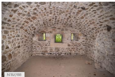
Fort de Saint-Cyr - Chambre de poste de tir