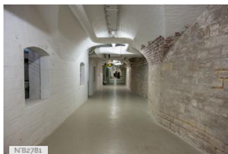
Fort de Saint-Cyr - Circulations intérieures