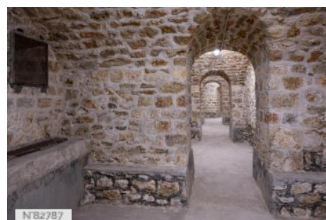
Fort de Saint-Cyr - Cellules