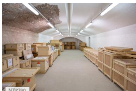
Fort de Saint-Cyr - Salle de réserve