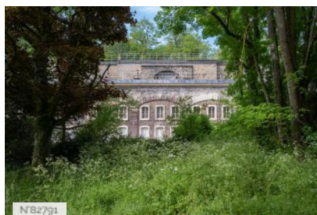
Fort de Saint-Cyr - Extérieurs