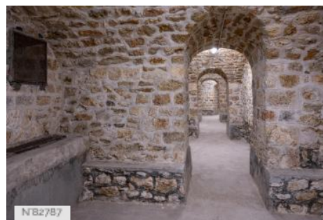
Fort de Saint-Cyr - Cellules