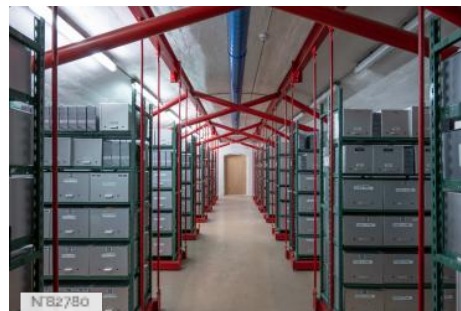
Fort de Saint-Cyr - Magasins d'archives