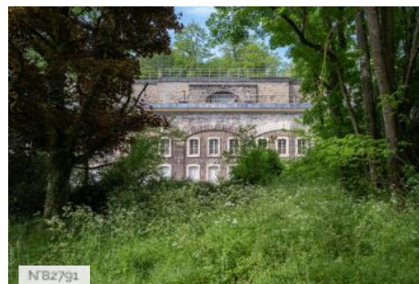
Fort de Saint-Cyr - Extérieurs