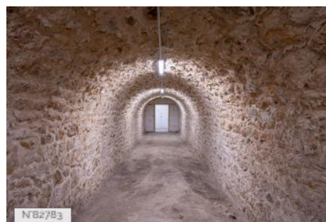
Fort de Saint-Cyr - Salles voutées