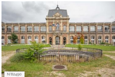
Hôpitaux Paris Est Val-de-Marne (Site Saint-Maurice) - Cour d'Honneur du site national