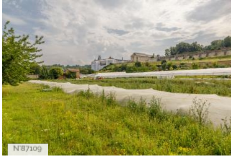
Les légumes du Château - exploitation maraîchère bio et locale