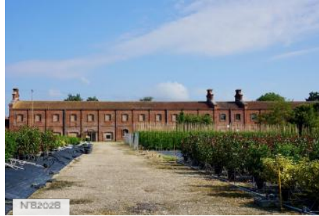
Pépinières - Anciennes colonies pénitentiaires