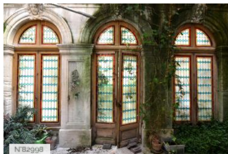
Hôtel particulier Adhémar