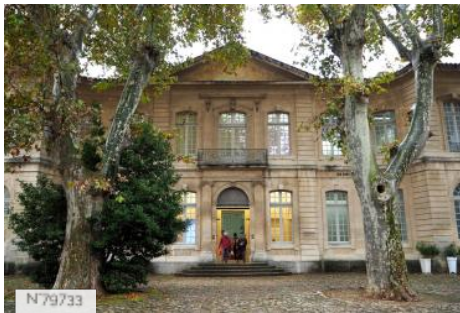
Musée d'art contemporain Collection Lambert - Extérieurs