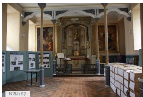
Chapelle du Lycée Théophile-Gautier à Tarbes