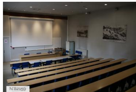
Auditorium du Lycée Théophile-Gautier à Tarbes