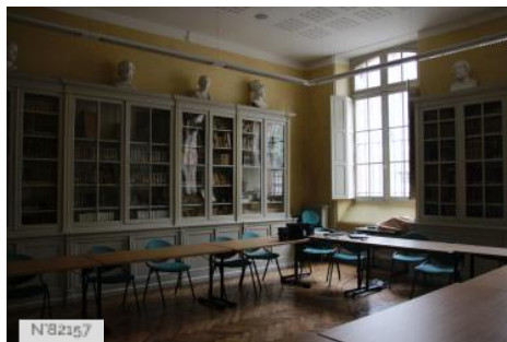
Lycée Théophile-Gautier à Tarbes - intérieurs