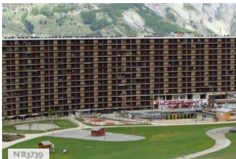
Residence Superdevoluy Bois d'Aurouze