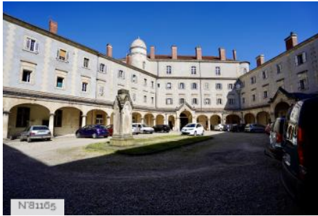
Cloître du couvent des Capucins