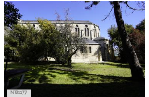
Jardin de la Chapelle