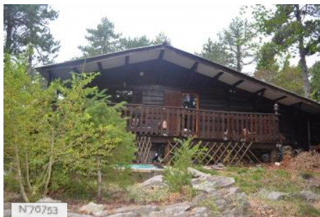
Chalet en bois au Mont Ventoux