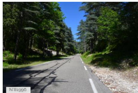
Route du Mont Ventoux coté sud