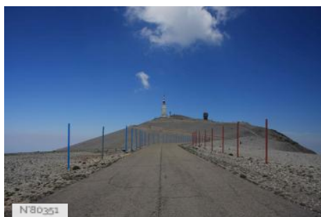
Route départementale du Mont Ventoux