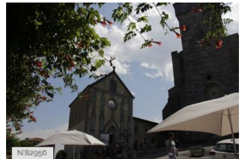
Chapelle des Olivétains