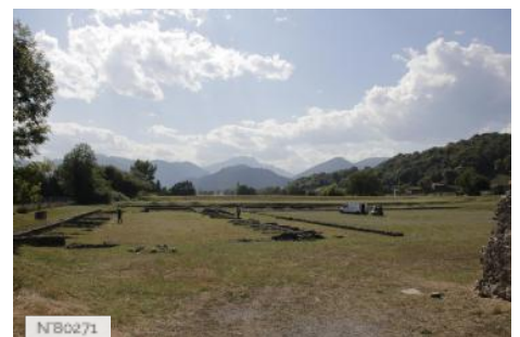
Site antique Lugdunum Convenarum