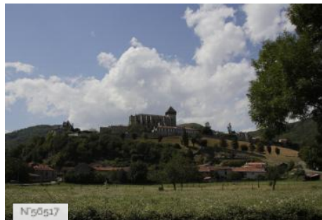
Cathédrale Sainte-Marie - extérieur