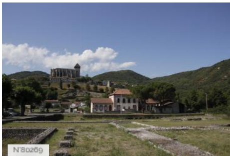
Village de Saint-Bertrand-de-Comminges