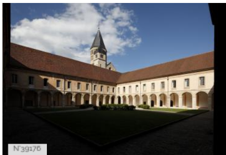
Cluny - Ancienne Abbaye