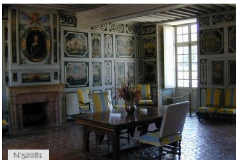
Château de Bussy-Rabutin - Intérieur