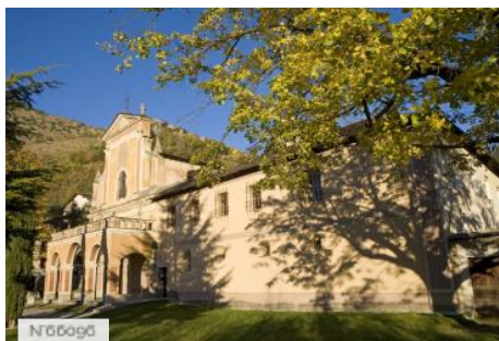
Monastère de Saorge