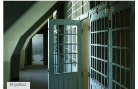
Prison du Château de Cadillac - Centre des Monuments Nationaux