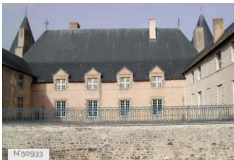
Château de Villeneuve Lembron - Extérieur - Vues Générales