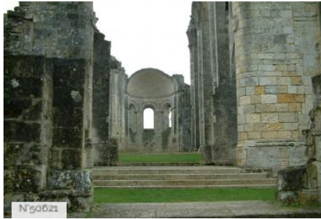
Abbaye de la Sauve-Majeure - Centre des Monuments Nationaux - la Sauve