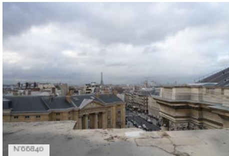
Le Panthéon - Colonnade