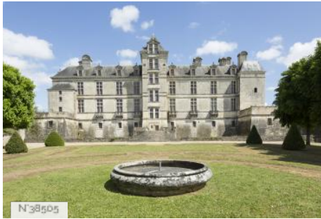
Château de Cadillac - Centre des Monuments Nationaux