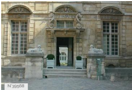
Hôtel de Béthune-Sully